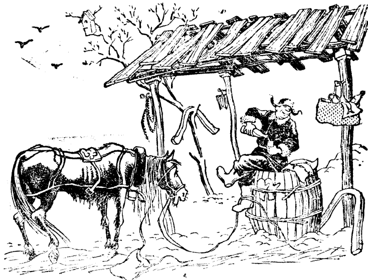
„Мне грустно... потому, что весело тебе“. Рисунок К. Теодоровича.