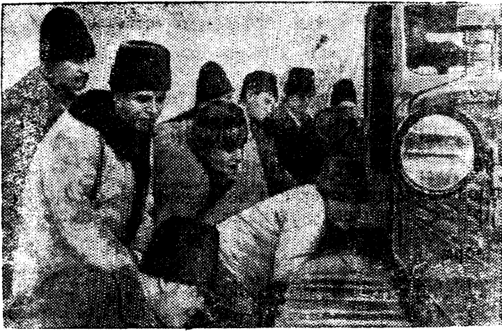
Колхозники недавно организованного колхоза "Новая жизнь" (село Кыцканы, Бендерский уезд) осматривают первый трактор, прибывший для обслуживания весенне-посевной кампании.

Каждый день в Молдавскую ССР прибывают десятки новых тракторов, которые прямо со станции отправляются во вновь организованные МТС и колхозы республики.