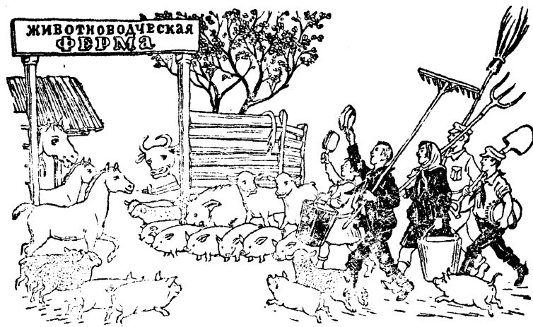
Рисунок В. Теодоровича.