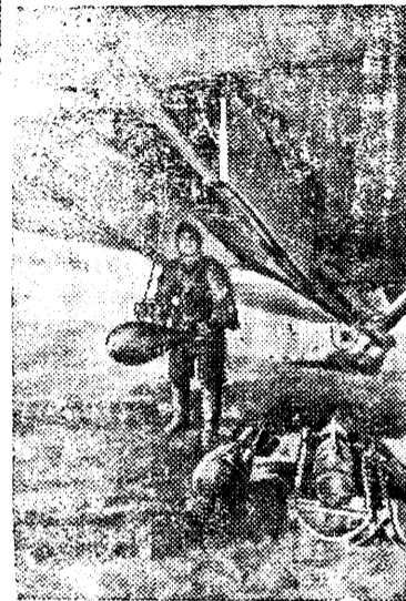
Перед боевым вылетом.