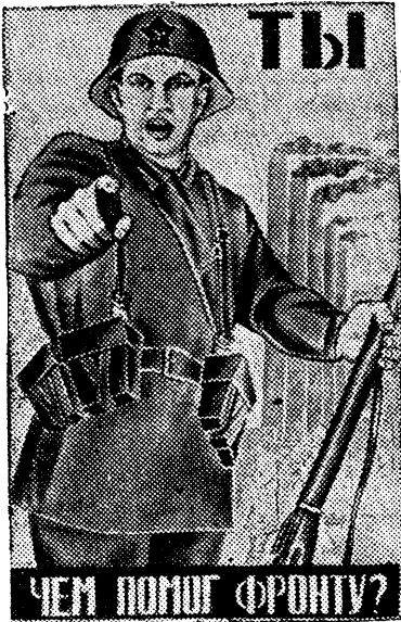
Рисунок художника Моор. (Репродукция с плаката выпускаемого издательством «Искусство».)

— Все для фронта, все для нашей любимой Красной Армии, все силы на разгром кровавых орд германского фашизма! — единодушно заявили рабочие и служащие коллектива Реполовской МТС. Трактористы, кузнецы, мотористы, инженеры и техники — все, как один, высказали свое искреннее желание всеми средствами, всей своей практической работой повседневно помогать Красной Армии в борьбе