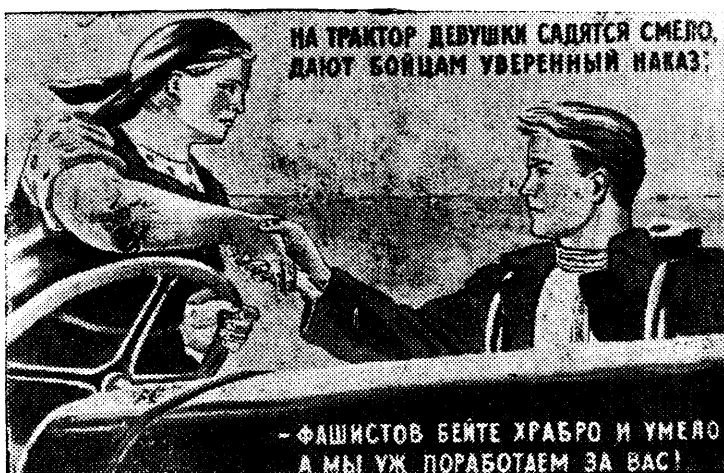
Рисунок Т. Ереминой. (Репродукция с плаката, выпускаемого издательством „Искусство“)

Командир другой немецкой пехотной дивизии, разгромленной на западном направлении, докладывает штабу фронта: „В дивизии осталось не более 80 офицеров. Есть роты, в которых нет ни одного офицера. Если в ближайшие дни не придет пополнение офицеров, то дисциплина окончательно расшатается и солдаты выйдут из повиновения. Учитывая усталость личного состава дивизии и нужду в свежих Godкреплениях, ходатайствую об отводе на некоторое время дивизии в тыл для отдыха и приведения в порядок...“ Командир 253 немецкой стрелковой дивизии выражает неудовольствие резервистами, прибывшими в части дивизии. По его описанию, большинство резервистов, это — необученные малоподвижные и инертные солдаты. Они очень плохо усвоили принципы современной войны, не умеют обращаться с автоматическим оружием и больше думают о сохранении своей жизни, чем о наступлении. Имея 4.000 таких солдат, я не могу считать дивизию вполне боееспособной...“