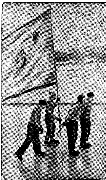
На снимке: Знаменосцы—хоккеисты спортивного общества „Динамо“ открывают парад.

ра в среду колхозной молодежи нашего округа.