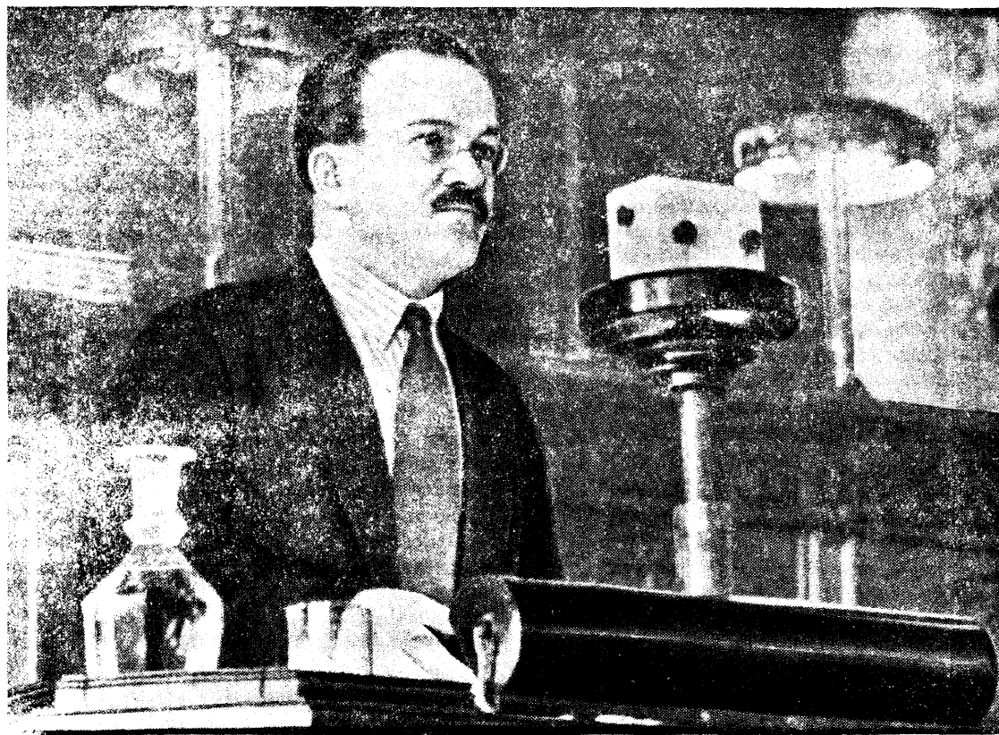
В. М. Молотов на трибуне Третьей Сессии ЦИК СССР (1933 г.)