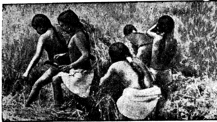
Дети из племени Кояк (Бирма) за сбором риса.