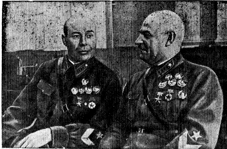
На снимке (слева направо): Маршал Советского Союза Народный Комиссар Обороны СССР тов. С. К. Тимошенко и Маршал Советского Союза тов. Г. И. Кулик.

Указами Президиума Верховного Совета СССР Героям Советского Союза—Командарму 1-го ранга С. К. Тимошенко и Командарму 1-го ранга Г. И. Кулику присвоено военное звание Маршала Советского Союза; Маршал Советского Союза С. К. Тимошенко назначен Народным Комиссаром Обороны СССР.