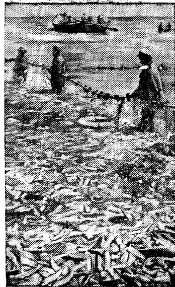
Лов сельди на Яламанском рыболовном промысле Азербайджанского сельдяного треста.

Невиданными косяками идет сельдь в Каспийском море. Одно притонение невода дает более 2000 центнеров сельди. Ряд рыболовных промыслов Азербайджана досрочно выполнили годовой план улова.