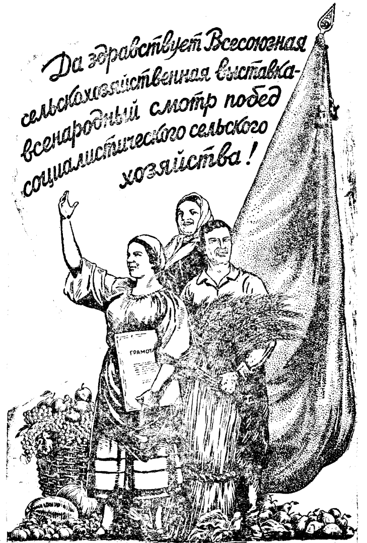
Рис. Р. Баркова и В. Лисевича.