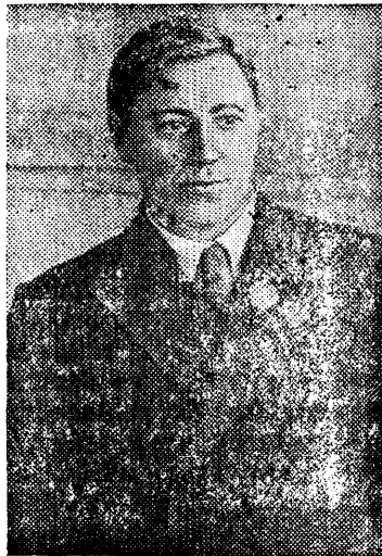
Заместитель Наркома Легкой промышленности СССР, один из первых пионеров стахановского движения тов. Н.С. Сметанин.

на приемочные пункты. Грибы и ягоды собирают 17 школьников. К 21 августа они сдали 110 килограммов ягод и 45 килограммов грибов. Оленев.