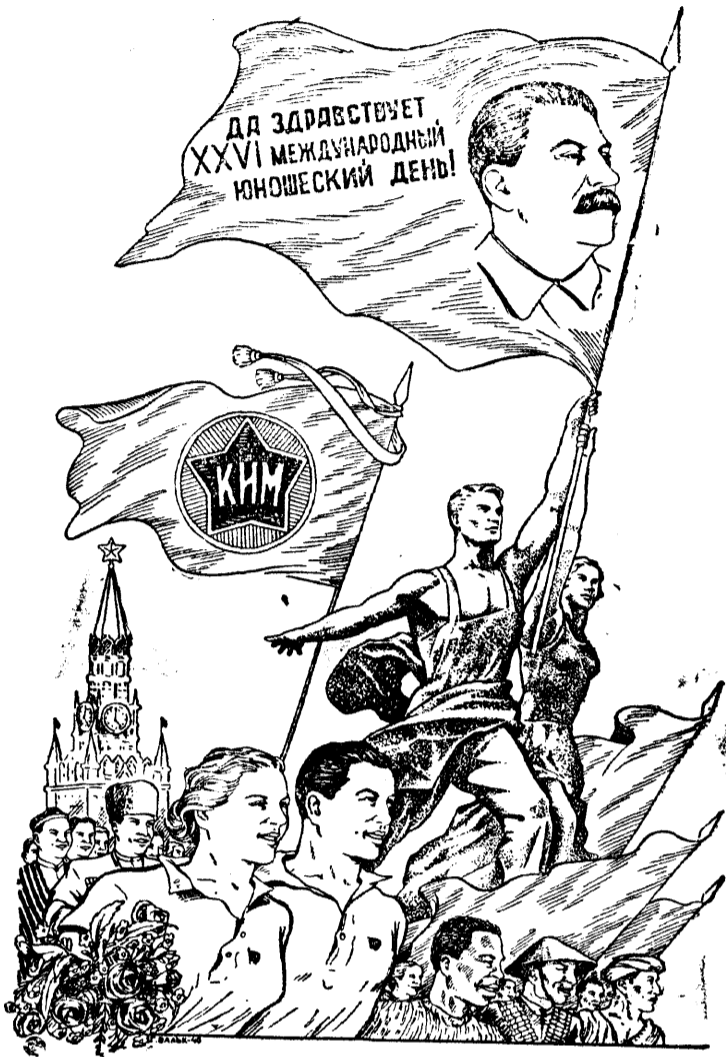
Рисунок Г. Вальк