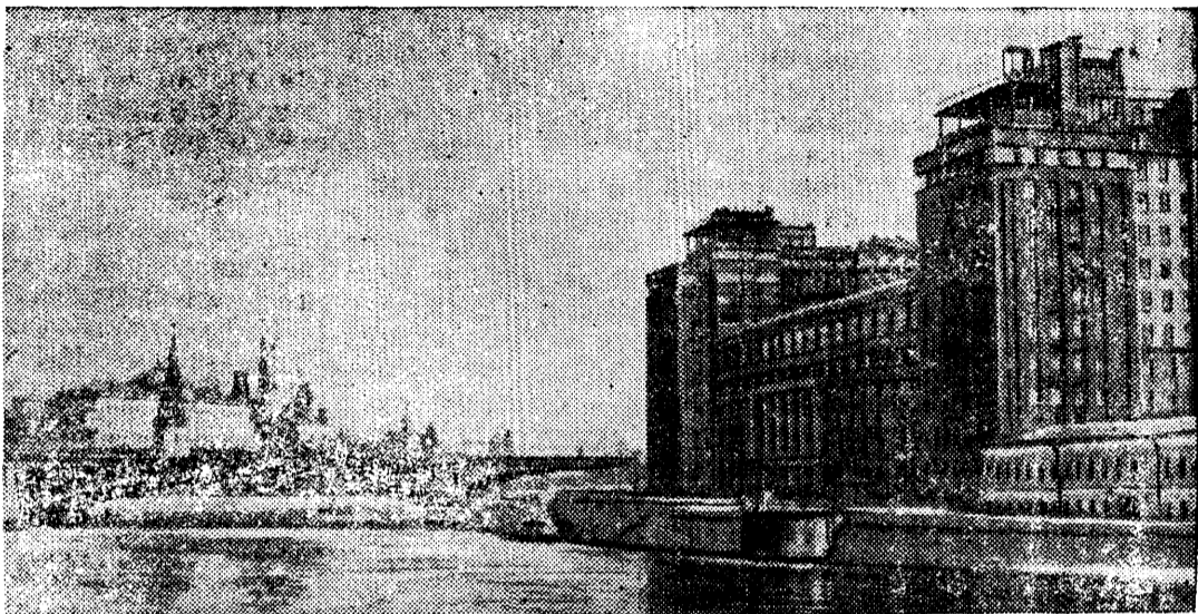
Вид на Дом Правительства. Большой Каменный мост и Кремль.