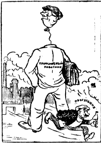
В роли наблюдателя. Рис. В. Лисевича.

Некоторые профсоюзные организации до сих пор стоят в стороне от повседневного контроля за неуклонным проведением в жизнь Указа Президиума Верховного Совета СССР от 26 июня 1940 г. (Из газет).