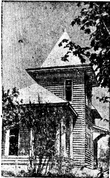
Строительство индивидуального коттеджа в Коптевом овраге.

На строительстве Куйбышевского гидроузла в живописной местности Коптева оврага сооружаются 24 коттеджа для инженерно-технических работников строительства.