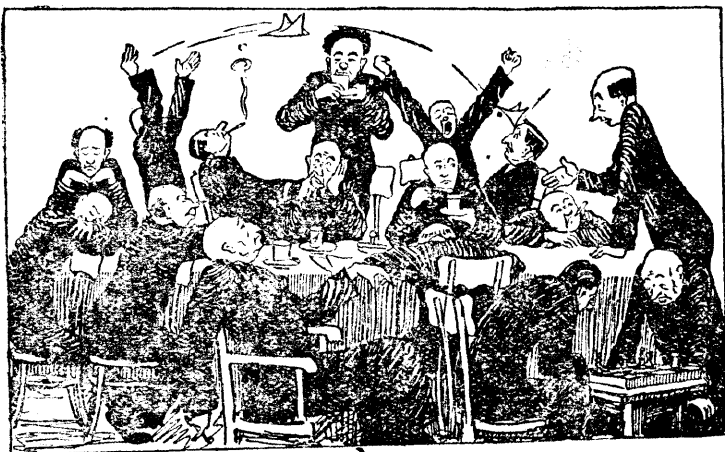
—Третий день мы заседаем и не можем решить, кого же сократить: уборщицу или сторожа... Рисунок Ю. Левченко.