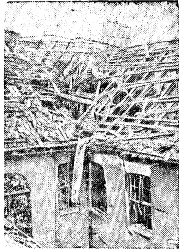
Жилой дом на Риттерштрассе, разрушенный в результате бомбардировки.

Бомбардировка Берлина английской авиацией.