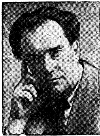
В. В. Куйбышев

снова арест в Самаре. Но ни аресты, ни тюремные заключения, ни ссылки—ничто не могло сломить неукротимую волю Валериана Владимировича к борьбе за освобождение трудящихся.