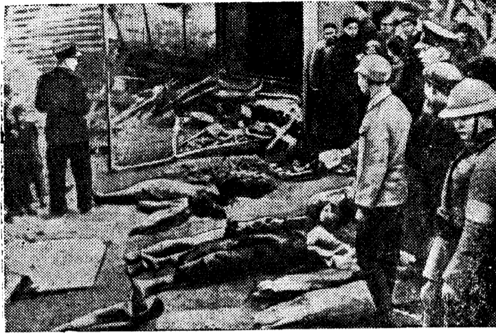
Японские захватчики варварски бомбардируют города и селения Китая На снимке: После одной из бомбардировок г. Чунцина.

Положение в Палестине осложняется и тем, что германский и итальянский фашизм всячески разжигает там анти-английскую борьбу, снабжает арабских вождей оружием, ведет фашистскую пропаганду. Для агрессоров Палестина весьма важна, ибо она расположена на морском пути Англии и является наиболее развитой страной с арабским населением. Откуда фашистские агенты проникают и в другие арабские страны, где ведут свою подрывную деятельность.