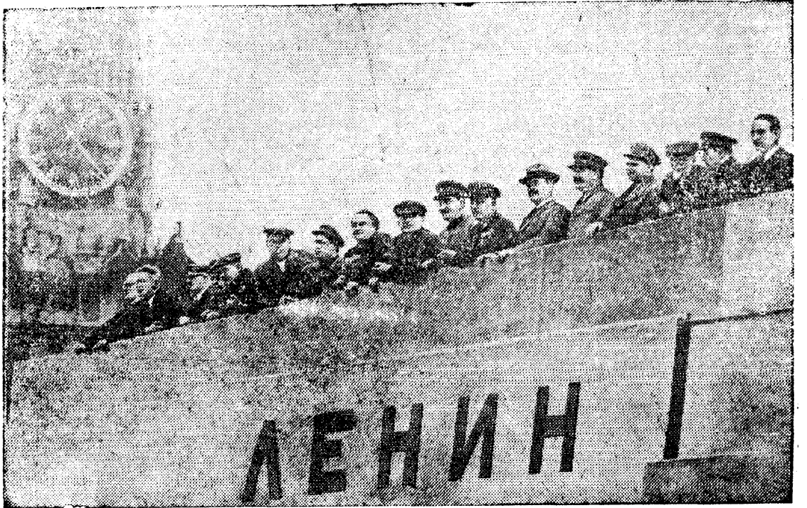
На трибуне мавзолея 1 Мая 1939 года.

Умелый контроль и хорошо поставленная проверка исполнения принятых решений оживят работу парторганизаций, сделают ее еще более действенной и обеспечат еще большие производственные успехи; они помогут нашим заводам, фабрикам, шахтам, совхозам, МТС, колхозам успешно выполнять исторические задачи Третьей Сталинской Пятилетки.