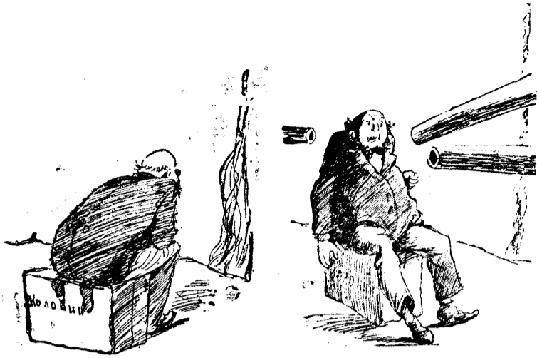
Английский джентльмен: —Моя хата с краю—я ничего не знаю. Рисунок Д. Дубинского.