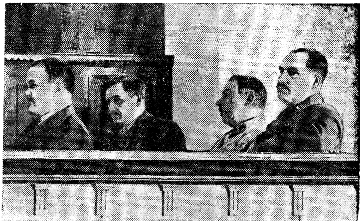
На снимке: слева направо — товарищи В. М. Молотов, Н. А. Булганин, К. Е. Ворошилов, и Л. М. Каганович в ложе Совнаркома, на заседании Совета Союза на третьей Сессии Верховного Совета Союза ССР.