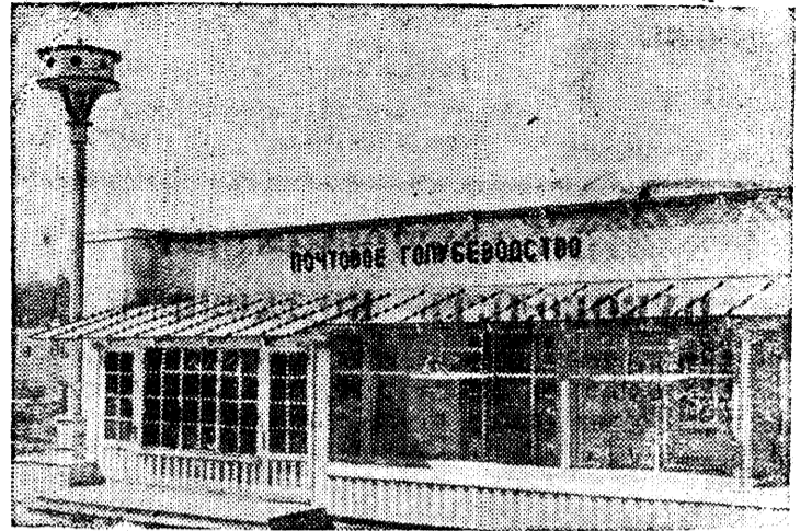
На снимке: Павильон «Почтовое голубеводство».

На строительстве Всесоюзной сельскохозяйственной выставки (Москва)