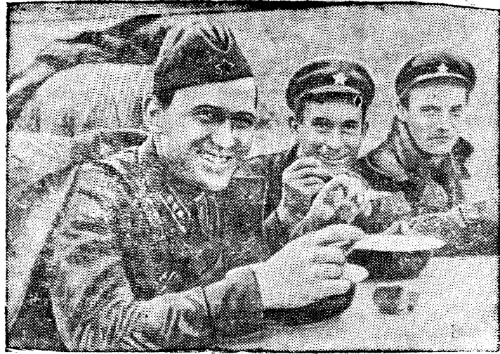
На снимке: Завтрак командного состава после боя у высоты Заозерной.

К годовщине разгрома провокаторов войны—японских самураев—в районе озера Хасан.