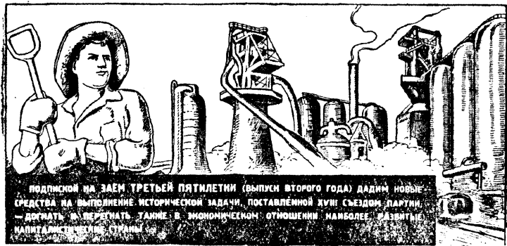
Репродукция плаката, выпущенного издательством „Искусство“.