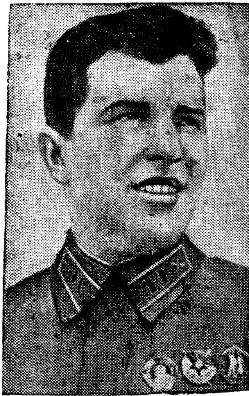
На снимке: Герой Советского Союза, награжденный второй золотой медалью „Герой Советского Союза“, майор Г. Н. Кравченко.

Цветами забросав живыми, Их спрашивают о родном И называют их родными. Так, значит, будет жизнь светла? Не уходите! Будем вместе! С бойцами жители села Походную заводят песню. А дружба с песнями крепка, И никогда ей не повалится. Над нами встали на века Победные знамена братства. ЕВГ. ДОЛМАТОВСКИЙ «Знамя советов» № 135.