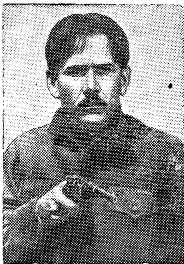
Артист Н. Дорохин в роли большевика Андрея из фильма «Волочаевские дни».