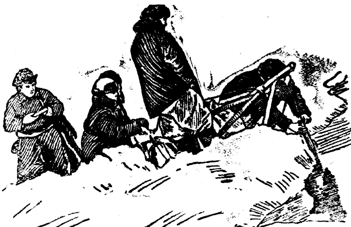
Участники экспедиции берут первую пробу воды на Северном полюсе.