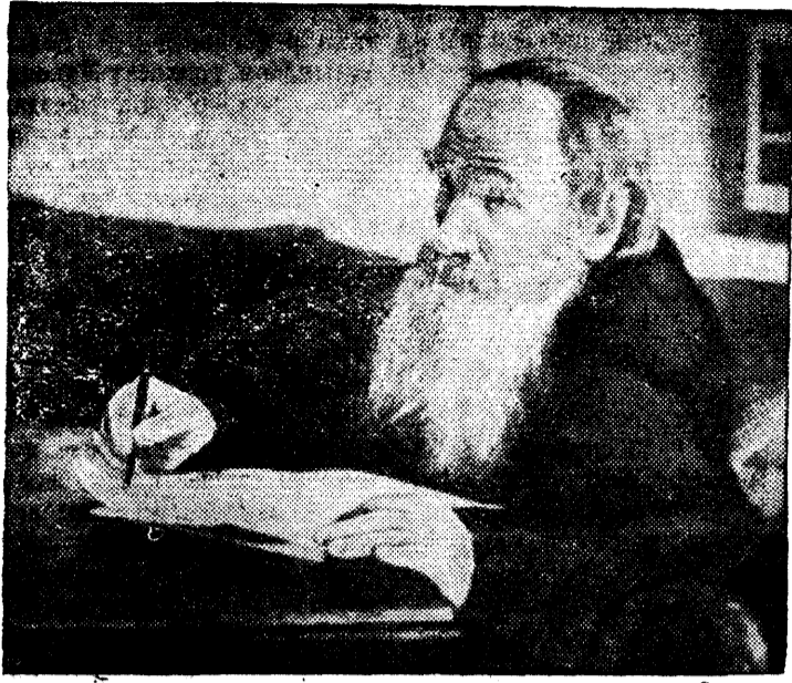
НА СН.: ЛЕВ НИКОЛАЕВИЧ ТОЛСТОЙ.

9 сентября исполняется 110 лет со дня рождения великого русского писателя Льва Николаевича Толстого. (1828—1910 гг.)