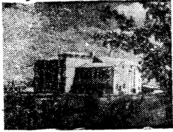
На сн.: Здание средней школы в г. Элиста, Калмыцкой АССР.