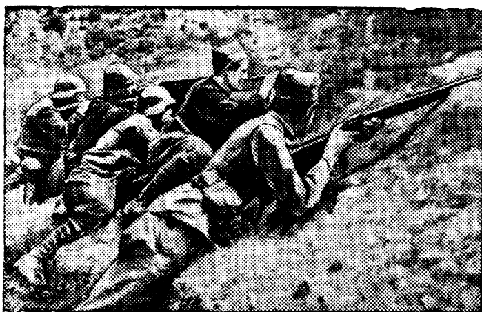
На сн.: Бойцы республиканской армии обстреливают позиции врага.