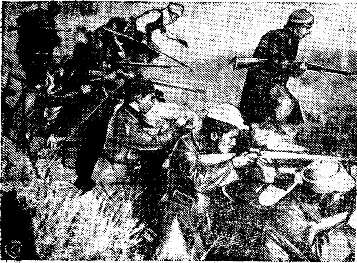
НА СНИМКЕ: отряд правительственных войск на мадридском фронте начинает контратаку.