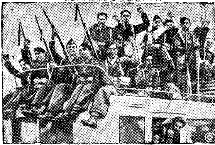
НА СНИМКЕ: колонна басков—бойцов правительственных войск, направляющихся из Бильбао на фронт.