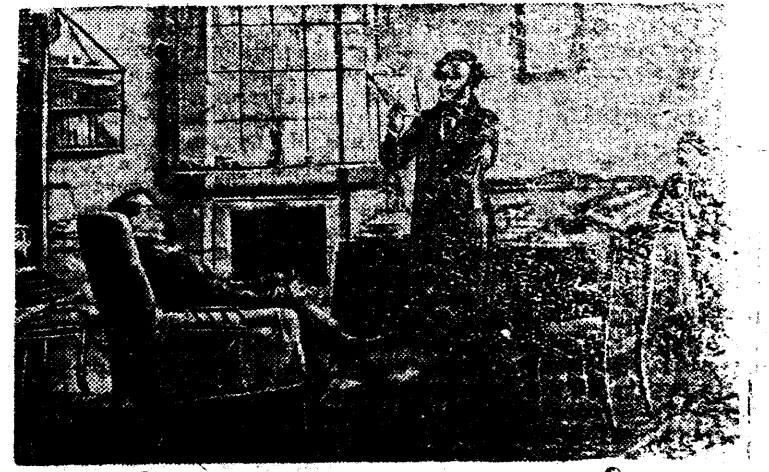
НА СНИМКЕ: Пушкин в ссылке в селе Михайловском. Посещение поэта И. И. Пущина.