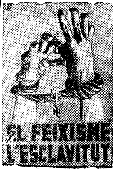
НА СНИМКЕ: антифашистский плакат в Барселоне. Надпись: „фашизм — это рабство“.