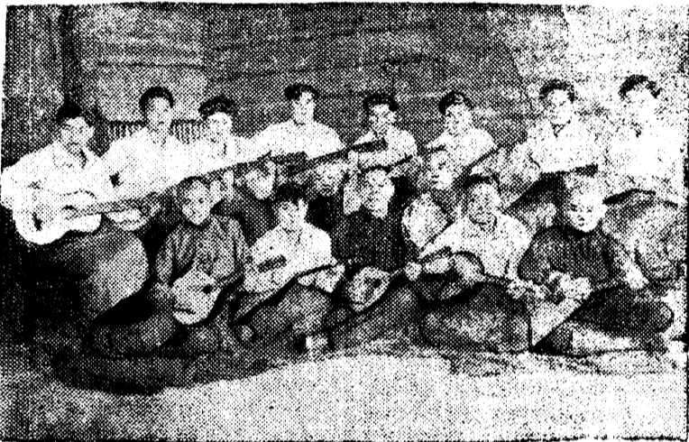
Цветет культура ханте-мансийского края. НА СНИМКЕ: струнный оркестр из студентов акциерско-фельдшерской школы в поселке Остяко-Вогульск.