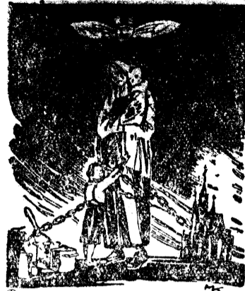
Женская доля у фашистов

Таков человеческий документ, заключает газета, разоблачающий пропаганду помещиков о том, что прошлый год был годом урожая.