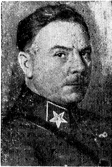
К. Е. ВОРОШИЛОВ

Велики и разнообразны достижения советской культуры, блестящим подтверждением чего служат ус-