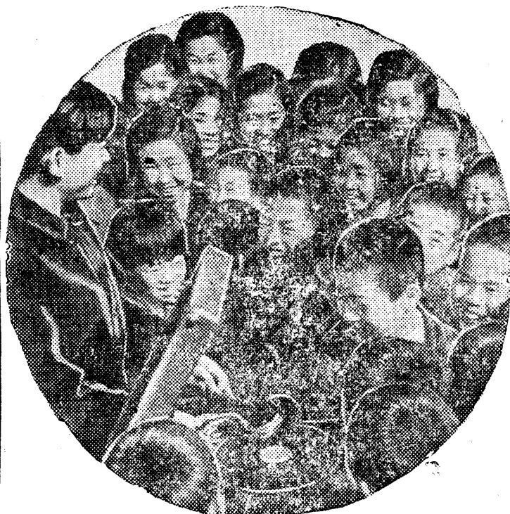
В перерыве между уроками учащаяся детвора корейского колхоза им. Сталина (Уссурийская обл. ДВК) любит послушать пластинки на своем родном языке.

Сессия утвердила все постановления, принятые ЦИК между четвертой и пятой сессиями.