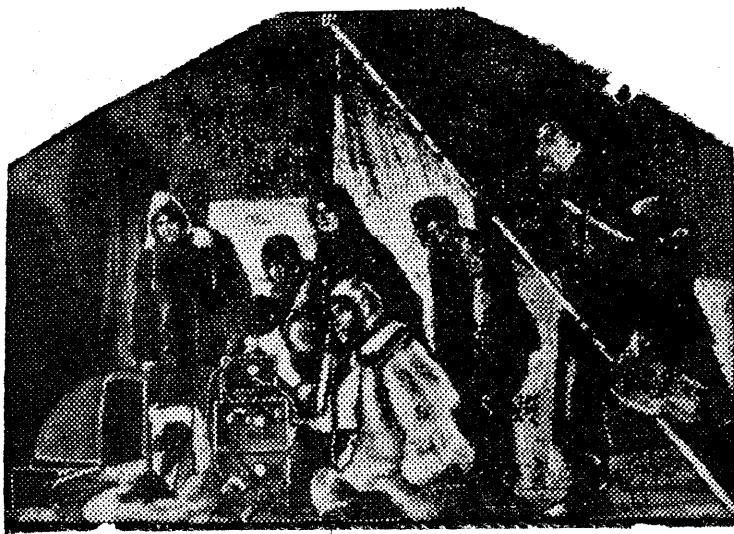
Сцена 3-го акта: слушают радиопередачу из Москвы.