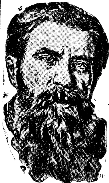
О. Ю. Шмидт—начальник экспедиции на Северный полюс.

Где для всех одинаково светит заря И кругом расцветают таланты. Не впервой нам творить чудеса наяву: С нами Полюс ведет переписку, Гидроплан из Сибири—садится в Неву, И красавица Волга—заходит в Москву, И Америка дальняя—близка! Как ты, враг, ни хитри, как ты, враг, ни мудри— Наша сила растет и не чахнет! Точно в сказке рождаются богатыри: Было три—и становится их тридцать три, Чуть лишь подвигом в воздухе пахнет. Уж таков наш свободный советский народ,— День и ночь он растет и хлопочет И готовит врагам от ворот поворот И идет что ни день все вперед да вперед И назад воротиться не хочет! ...Тает сумрак ночной над Советской страной, Детям снится чудесная птица, Гаснут белые звезды одна за одной, И проходят дозоры тропинкой лесной У далекой Советской границы. Вас. ЛЕБЕДЕВ-КУМАЧ. (Перепечатано из „Правды“).