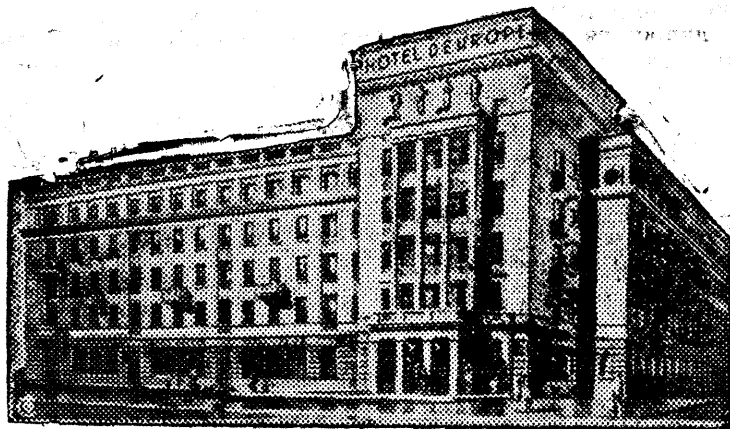
Проект гостиницы в Уфе (начата строительством в прошлом году).