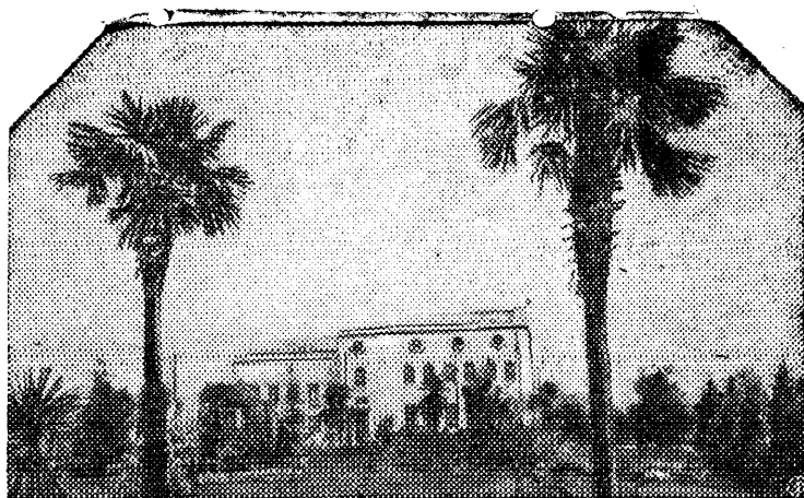
Опытная чайная фабрика научно-исследовательского института чайного хозяйства в Анасуели.