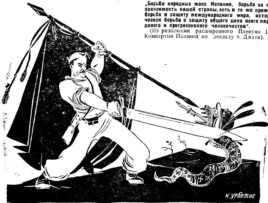
„Борьба народных масс Испании, борьба за независимость нашей страны, есть в то же время... борьба в защиту международного мира, историческая борьба в защиту общего дела всего передового и прогрессивного человечества“.

(Из резолюции расширенного Пленума ЦК Компартии Испании по докладу т. Диаса).