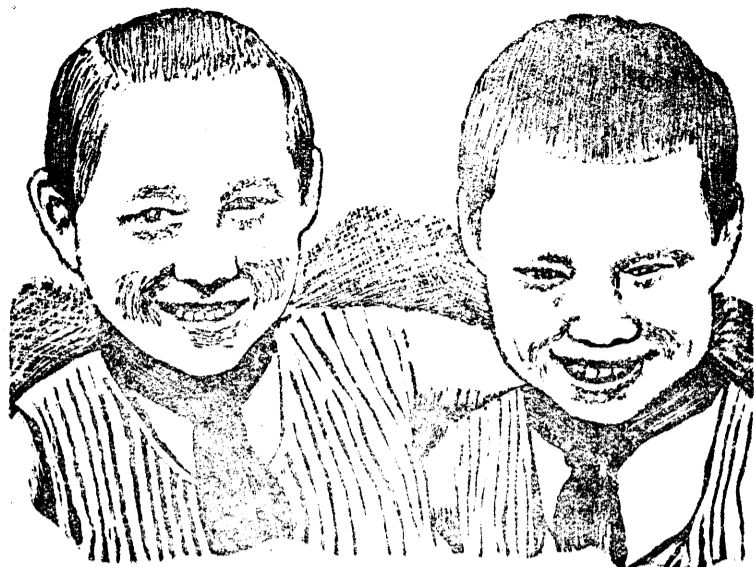
Пионеры на отдыхе.