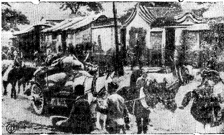
Жители предместий Бейпина бегут из родных мест, оккупированных японскими захватчиками.