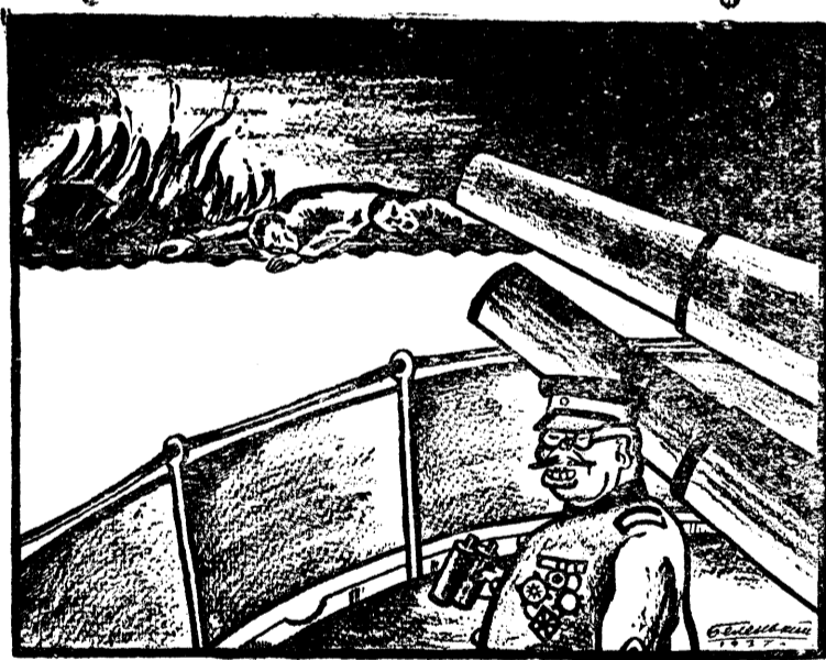
Японский метод убеждения.