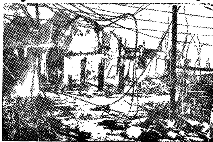
Один из кварталов Нанкина после японской бомбардировки