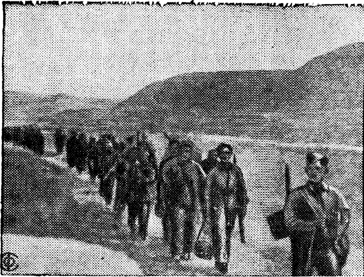
Продвижение отряда республиканских войск по старой Сарагосской дороге. (Восточный фронт).