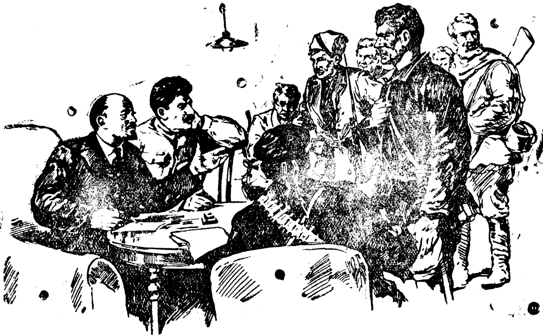
В. И. ЛЕНИН и И. В. СТАЛИН в Смольном.