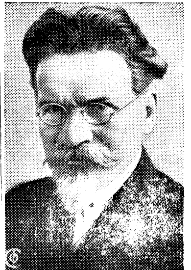
Тов. М. И. Калинин.