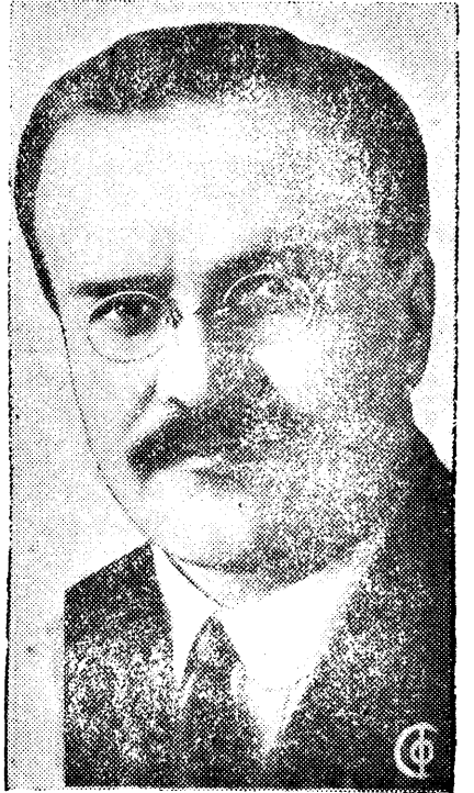
Тов. В. М. Молотов.

(Из речи тов. И. В. Сталина 11 декабря 1937 года).