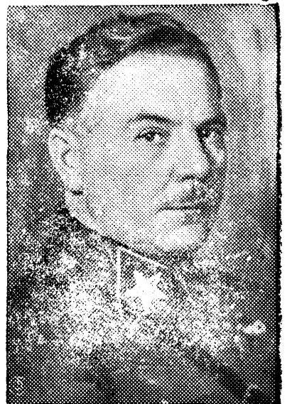
Тов. К. Е. Ворошилов.