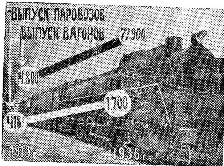
На снимке: Диаграмма выпуска паровозов и вагонов (готовые паровозы «ФД» перед отправкой с Ворошиловоградского паровозостроительного завода).

Чудесные цифры социалистических побед. К выборам в Верховный Совет СССР наша Родина пришла мощной социалистической индустриальной страной.