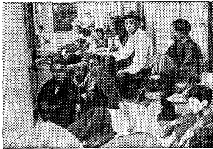
Жители Шанхая, лишенные крова в результате бомбардировки города японской авиацией, ютятся на улицах.