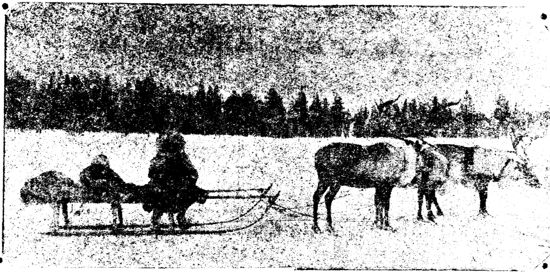
В нашем округе за пятилетие созданы оленсовхозы. Березовский и Сынский оленсовхозы насчитывают в своих стадах свыше 12500 голов.