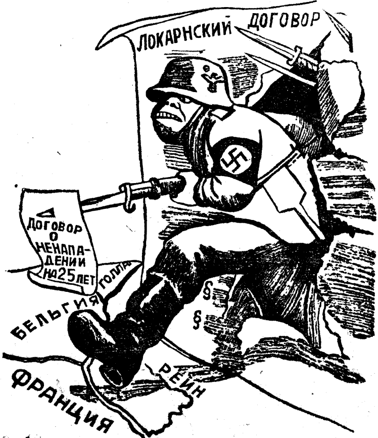
„Мирные“ шаги германского фашизма