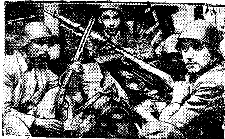
Организованная рабочими милиция показывает чудеса храбрости и энтузиазма в боях с фашистскими мятежниками в Испании. НА СНИМКЕ: отряд рабочей милиции у пулемета.

Первая спартакиада должна послужить громадным толчком в деле развращения физкультурного движения в каждом районе, колхозе и бригаде.